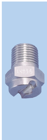
【スプレーパターン】